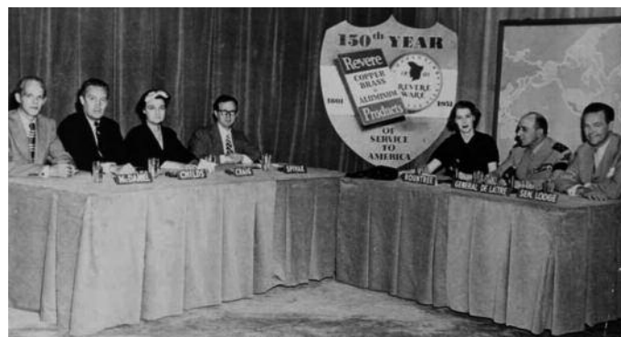
Le général de Lattre sur le plateau de Meet the Press

Le premier, le 16 septembre, lorsque de Lattre se rend dans les studios de la chaîne NBC, à New York, pour la fameuse et redoutable émission « Meet the Press ».