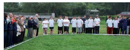
La cérémonie des couleurs du rallye citoyen 2012. 132 élèves de 9 collèges ont participé à cette importante manifestation.