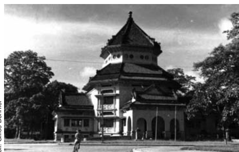
Le musée Finot à Hanoï, aujourd'hui Musée national d'Histoire du Vietnam.

Une bibliothèque et un musée – devenu depuis Musée national d'Histoire du Vietnam – viennent bientôt compléter l'installation du siège. D'autres musées sont ensuite créés : Da Nang, Saïgon, Hué, Phnom-Penh, etc.