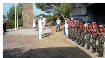
Cérémonie à la batterie côtière de Mauvianne