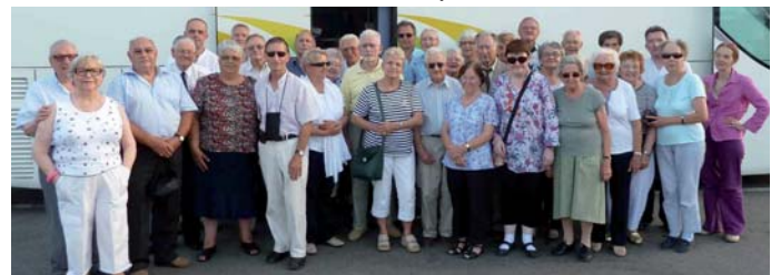
Les 37 participants au voyage

Enfin le 21 août : le Comité, en partenariat avec Rhin et Danube-21, UNC-Talant et l'Amicale des A.C.-Fontaine-les-Dijon a organisé une visite de Turckheim et en particulier de l'exceptionnel Musée Mémoires des combats de la poche de Colmar.