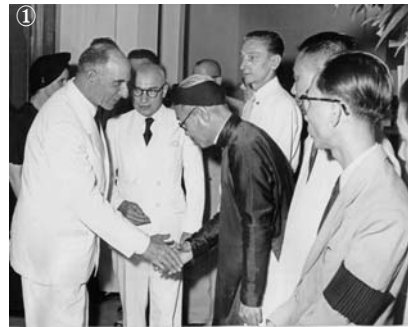
Après les discours, le général de Lattre salue les personnalités présentes, photo 1. Sur la photo 2 le général de Lattre salue Mgr Urrutia, évêque de Hué. A l'arrière-plan on distingue plusieurs panneaux montrant le rayonnement dans le monde de l'Ecole Française et la présentation de travaux de sauvegarde et de restauration des temples d'Angkor Vat par des archéologues de l'Ecole Française.

C'est tout ce travail que présente, le 7 novembre 1951, M. Malleret, au Général et à Madame de Lattre venus féliciter, soutenir et encourager les chercheurs de l'Ecole Française d'Extrême Orient à l'occasion de son cinquantième anniversaire.