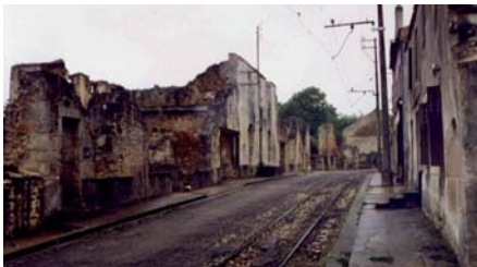
Les ruines du village ont été maintenues en l'état et témoignent de l'odieux massacre. Le village a été classé Monument historique en 1946.

anniversaire du massacre de la population (642 victimes dont 300 enfants) par un groupe de S.S. appartenant à la division « Das Reich ».