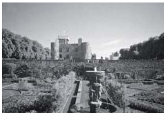
Château d'Opme 1 , en 1941

C'était en 1940. Evadé du stalag XII B sur le plateau de Petrisberg en Allemagne, j'ai retrouvé une France blessée, meurtrie, coupée en deux. Mon souci était de réengager comme sergent, ce que je fis au 151 Régiment d'Infanterie. Un jour, à Clermont-Ferrand sur un stade ... mon destin s'est dessiné. Un Général, en inspection, du doigt a désigné à un officier l'accompagnant... une petite