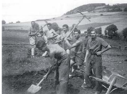
Travaux de terrassement