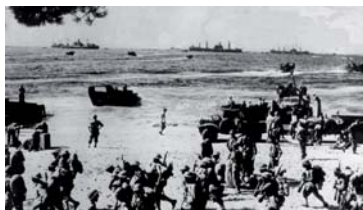
Débarquement en Baie de Pampelonne