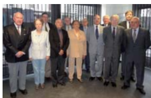
Le membres du conseil en début de réunion