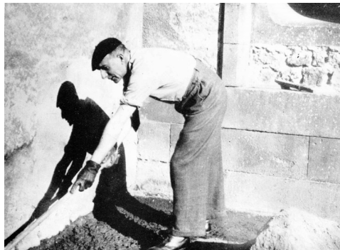
Le général de Lattre s'adonne à un peu d'exercice dans une cour de la prison de Riom.

Après avoir sauvé l'honneur de l'armée en tentant de résister à l'invasion allemande dans les Corbières, avec l'Ecole des Cadres de Carnon, le général de Lattre est arrêté le 11 novembre 1942 et condamné à dix ans de travaux forcés. Il est interné à la prison de Riom gardée par la gendarmerie.