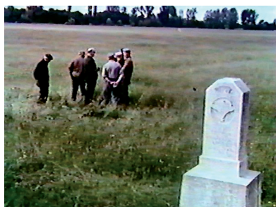
La prairie de Manziat au début des années 1970. Non loin de la stèle commémorative quelques-uns des anciens Résistants qui assurèrent le balisage, la garde du terrain d'atterrissage et la mise en sûreté des passagers.