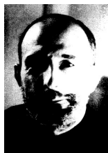
Jean de Lattre, alias Charles Dequenne. On a du mal à reconnaître dans cet homme barbu, à la tenue assez négligée, le prestigieux général de corps d'armée.