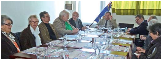
Une partie du Comité avant le déjeuner qui a terminé une matinée bien remplie.