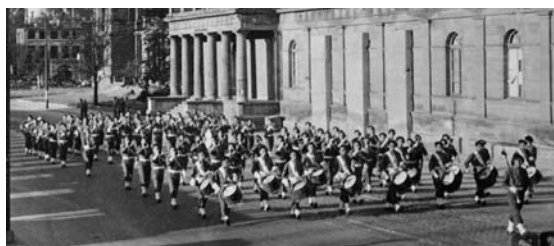
La musique du 49 e RI sur la Siegesallee

Le 2 avril, il passe le Rhin à Spire sur des canots. Il est de tous les combats de la division aux trois croissants (*) jusqu'à la prise de Stuttgart le 20 avril. Le 7 septembre 1945, le CFP, devenu le 49 e RI, est désigné pour le défilé de la victoire des Alliés dans Berlin sur la Siegesallee.