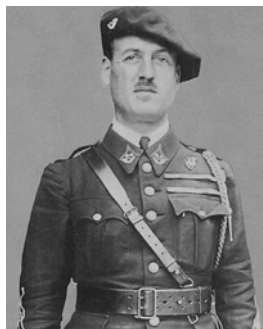
Antoine Béthouart en 1928

Après Saint-Cyr, Promotion Fez, 1909-1911, celle d'Alphonse Juin et de Charles de Gaulle, Antoine Béthouart est affecté au 152 ème RI dans les Vosges. Il participe à la Grande Guerre dès 1914. Il se bat dans l'infanterie en Alsace, à Verdun, sur la Somme, au Chemin des Dames, mais aussi au Mont Kemmel en Belgique. Blessé trois fois, il termine la guerre comme capitaine avec la Légion d'honneur, la croix de guerre et trois citations.