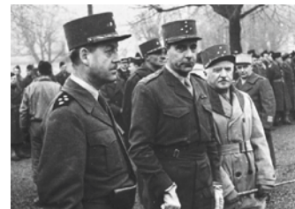
Les généraux Béthouart, de Lattre et de Monsabert, à Belfort, après la libération de la ville.

En septembre 1944, le général Béthouart prend le commandement du 1 er corps d'armée au sein de la Première Armée du général de Lattre. On lui doit, en novembre 1944, la splendide offensive du Doubs où en six jours il prend Montbéliard, Delle, atteint le Rhin le 19 novembre, libère Mulhouse et Belfort le surlendemain. Il encercle un corps d'armée allemand.