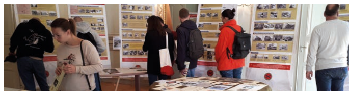
Panneaux dans le grand salon. Sur les tables on distingue différents documents et des livres de la Fondation proposés à la vente.

Dans le cadre des journées du patrimoine, les 16 et 17 septembre, l'exposition de la Fondation: le général de Lattre et la Première Armée Française, l'alchimie d'une victoire, 1944 – 1945 a été présentée à l'Hôtel de Clevans, dans le bureau qu'a occupé le général de Lattre