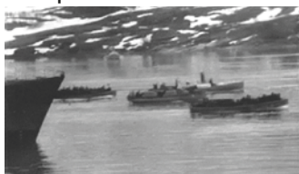
Débarquement des troupes françaises à Narvik.

En septembre 1939, lorsque la guerre éclate, le colonel Béthouart a 49 ans. Il commande la 5 ème demi-brigade de chasseurs à Chambéry. Il est envoyé à Bitche, sur la ligne Maginot. En février, il est nommé général et constitue la division légère de chasseurs composée de deux demi-brigades de chasseurs alpins (la 5 ème et la 27 ème ), de la 13 e demi-brigade de la Légion étrangère et d'une brigade de chasseurs polonais. Il est alors envoyé en Norvège avec sa division.