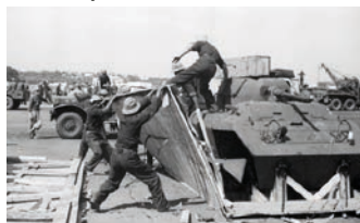
Hiver 1944, port de Casablanca : un liberty ship vient de débarquer sa cargaison de matériel militaire pour les troupes françaises. Des hommes sortent un blindé léger (M 8 ?) de sa caisse de transport.

Au Maroc, il dirige la commission d'armistice avant de prendre, en janvier 1942, le commandement de la division de Casablanca. Les Allemands le notent : « grande apparence, élané, aimable mais sur la réserve et froid... croit qu'il aura un rôle à jouer dans le futur. » Il tentera d'empêcher les combats contre les Américains lors du débarquement du 8 novembre 1942. Emprisonné, il sera condamné à mort. Mais le général Giraud annule la condamnation et le nomme, général de division et chef de la mission française aux Etats Unis, en décembre 1942,