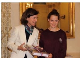
Remise du Prix spécial par Madame la Préfète.

L'émotion des parents voire même leur surprise de voir leurs enfants mis dans la lumière, leur fierté, nous donnent du baume au coeur et nous confortent dans notre volonté de continuer. A cette occasion, l'Assemblée départementale et le Souvenir français ont remis un prix et Mme la Préfète a récompensé par un Prix spécial la lauréate la plus jeune.