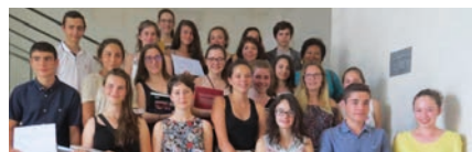
Les lauréats du concours 2017 après la remise des prix au Collège Gambetta de Cabors.

La Comité apporte également son soutien au Concours de la Déportation et de la Résistance et offre régulièrement en Prix des livres de la Fondation aux lauréats.