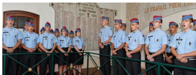
Un groupe d'élèves pendant l'interprétation de l'hymne national.

donnant ainsi l'exemple de la foi dans l'avenir. Rappelons que M. Michel Serves fut l'un des premiers à entrer sur la Place Rapp lors de la libération de Colmar en février 1945. Il avait alors 20 ans.