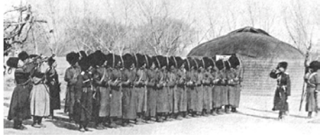
Le colonel Hagondokoff passe en revue des cosaques de son unité

Le 6 février 1898 naît, dans la Caucase, Galli Hagondokoff. Elle est la fille d'un officier issu d'une vieille famille caucasienne, les kabardes. Galli est la seconde d'une fratrie de huit enfants.