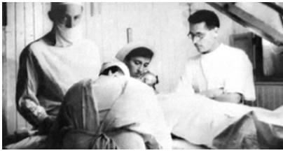
Intervention sur un blessé. Grâce à l'aide américaine, la FCM 1 dispose d'un matériel de pointe et d'un excellent approvisionnement en médicaments.

Fin novembre, à Rougement, lors de l'offensive du Doubs, elle manque de se faire submerger par une forte montée des eaux, mais la promptitude de sa réaction sauve de l'inondation la FCM 1 qui reprend de nuit les soins aux blessés. Le 30 novembre, la FCM 1 est à Dannemarie récemment libérée. Le