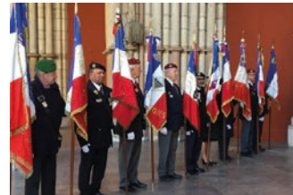
Une partie des 25 porte-drapeaux ayant participé à l'office religieux en l'église Notre-Dame de Dijon, le 14 janvier, à l'initiative du Comité de Côte-d'Or et en partenariat avec le Comité de Dijon du Souvenir Français.

Dans les départements de nombreuses cérémonies ont commémoré la mémoire du Maréchal de Lattre et des Combattants de la Première Armée Française et d'Indochine, notamment à Mulhouse ou à Dijon où des offices religieux ont été célébrés.