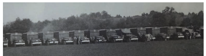
Les véhicules de la Formation chirurgicale n° 1.

Après l'Italie, la FCM 1 débarque en France avec la 2 ème Division d'Infanterie Marocaine.