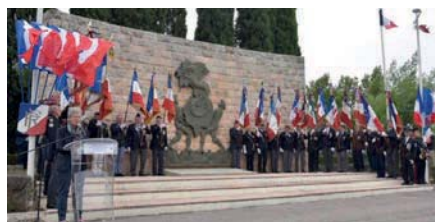
Mme Darrieussecq lors de son allocution.

Le 15 octobre, Mme Darrieussecq, secrétaire d'Etat auprès de la ministre des Armées, a présidé la cérémonie d'hommage aux 21 militaires français et vietnamiens morts le 12 mars 1949 lors d'une mission de parachutage dans le Nord du Tonkin à l'occasion de leur inhumation au Mémorial des guerres d'Indochine de