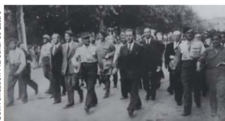
Le 2 septembre 1944, le général de Lattre salue la foule en liesse dans Montpellier libérée.

C'est enfin à Montpellier qu'il revient en général vainqueur, le 2 septembre 1944, pour célébrer la libération de la Ville.