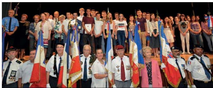
Les lauréats aux côtés de Mme Cornu et de plusieurs membres du Comité. Au premier plan les porte-drapeaux qui ont honoré de leur présence la remise des Prix du Comité départemental.

JUIN Le 6 , à salle des fêtes de Chenôve, le Comité a procédé à la traditionnelle remise des Prix d'Histoire (9ème édition) à 63 élèves de Troisième du département, devant plus de 320 invités.