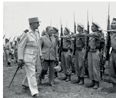
Le général de Lattre, accompagné du président Tran Van Huu, chef du gouvernement, passe en revue les troupes victorieuses à Vinh Yen.

La première victoire du général de Lattre est acquise. Hanoi est sauvée. La victoire est aussi psychologique tant son impact est grand sur les populations.