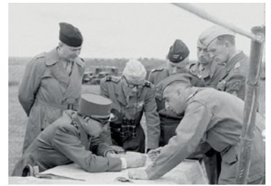
Le général de Lattre, ici avec le colonel de Castries et un groupe d'officiers, décide des opérations à mener.

Le 14, le général de Lattre se rend à Vinh Yen alors que la bataille fait rage. Son avion, un petit morane, se pose à quelques centaines de mètres des premières lignes vietminh. Il vient, sur place, analyser la situation et donner ses ordres.