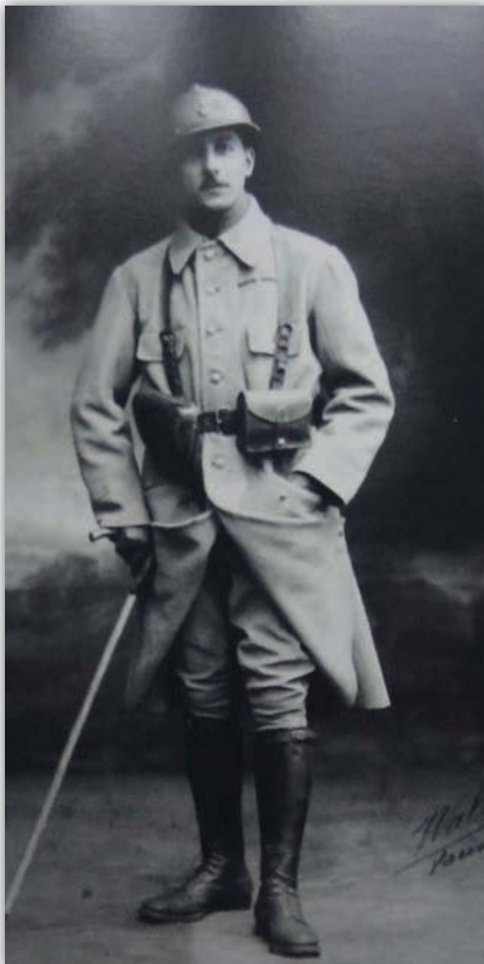
Le capitaine de Lattre au 93ème Régiment d'infanterie, chez qui on salue déjà « le talent du baroudeur mais aussi la maîtrise du tacticien ».

F. de Saint-Aubin et les Membres du Bureau National