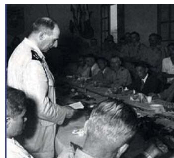
Le général de Lattre à Vinh Yen, le 19 avril 1951.

Le général de Lattre va utiliser la victoire de Vinh Yen, et par la suite, la série de succès militaires (Mao-Khé, Dong Trieu, le Day, Nghia Lo, Hoa Binh), pour redonner confiance à l'armée et à la population ainsi que pour convaincre le gouvernement vietnamien de Bao Dai de s'engager clairement dans la lutte contre le Vietminh communiste. Sur les lieux mêmes de la bataille de Vinh Yen, il plaide en ce sens lors d'une rencontre avec le président Tran Van Huu et son gouvernement, le 19 avril 1951.