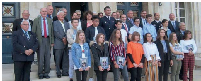
Les lauréats sur le perron de la Préfecture avec les Autorités.

Précédé par une photo de groupe sur le perron, un cocktail offert par la préfecture a conclu cette sympathique cérémonie. Elle a permis aux organisateurs, aux Autorités et aux invités de s'entretenir avec les élèves et leurs parents. Un bel exemple de réunion intergénérationnelle.