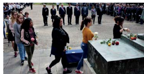
Par ce geste symbolique, ils ont chacun rendu hommage aux Morts pour la France.

Des élèves du collège Samuel de Missy sont venus déposer une fleur devant le monument aux morts.