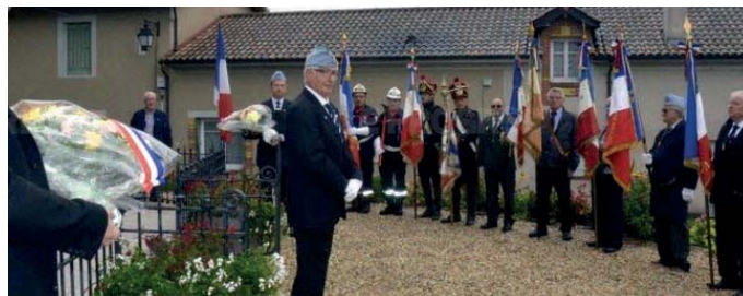
Cérémonie au monument aux morts de Pont-de-Vaux.