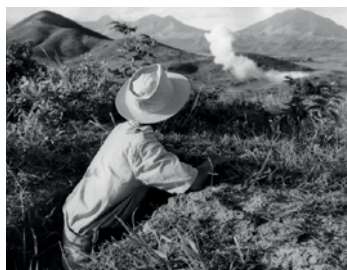
Officier réglant les tirs d'artillerie.

La contre-attaque française est fulgurante. Le temps dégagé permet les réglages d'artillerie et les raids d'aviation. Les chasseurs bombardent, entre autre avec du napalm, les dizaines de milliers de Bo-dois fortement armés qui surgissent de la jungle et des collines environnantes.