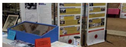
Une partie de l'exposition de la Fondation au château d'Auxonne.

Du 5 au 7 , le Comité a présenté l'exposition Le Général de Lattre et la Première Armée Française au