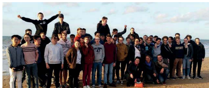
Les élèves de Première sur une plage du débarquement.