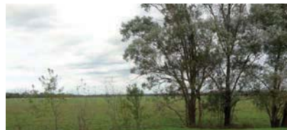
Le terrain de l'Aigle aujourd'hui. Entre 1942 et 1944, huit atterrissages y furent organisés par la Résistance malgré les énormes dangers.