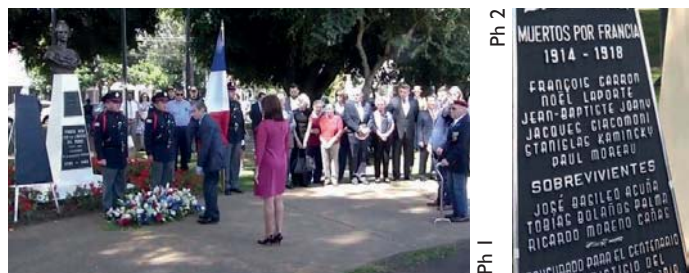
Cérémonie du 9 novembre, place de France, à San José.

ambassadeur de France, des représentants du gouvernement costaricien, de lycéens et d'un nombre public.