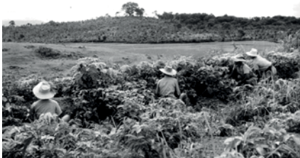
Des soldats en embuscade pour endiguer la progression des Bo-dois.

exécuter son plan car il est convaincu qu'il mènera à une grande victoire contre Ho Chi Minh.