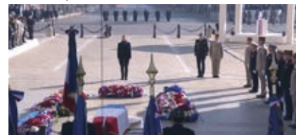
Hommage à Hubert Germain lors de la Cérémonie sous l'Arc de Triomphe.

Le même jour, Hubert Germain est inhumé dans la crypte du Mémorial de la France combattante, au Mont Valérien, dans le caveau réservé au dernier membre de l'Ordre de la Libération.