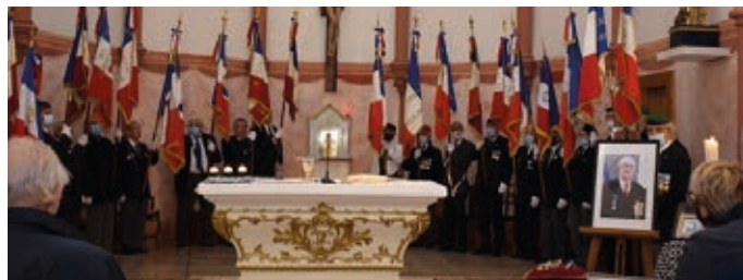
Les porte-drapeaux dans le chœur de l'église Sainte Cécile.