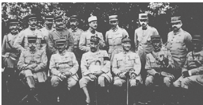
Le commandant de Lattre à l'Ecole de Guerre. Il est debout, le 3ème à partir de la droite. En 1927, lorsqu'il intègre l'Ecole de Guerre, son prestige et son grade lui valent d'être nommé chef de la promotion. En juillet 1929, il sort major de la 49ème promotion.

En un temps où l'aspect technique des problèmes militaires confère la prédominance à l'officier type « Ecole supérieure de guerre », Jean de Lattre a réussi à démontrer la prééminence de l'homme de génie. (...) La disparition d'un tel chef est une lourde perte non seulement pour la France mais pour l'Europe toute entière.