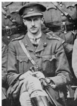
Sir B.H. Liddel Hart en uniforme de capitaine pendant la Seconde guerre mondiale.

Réformateur, il souleva plus d'opposition que s'il s'en était tenu à son rôle de chef. Ses convictions passionnées se heurtaient avec impatience à la lenteur des esprits et aux opinions contradictoires. En public, son sentiment de l'évènement historique et la touche dramatique dont il aimait auréoler les actes de commandant le portaient à susciter les enthousiasmes, ce qui pouvait amener, et ce qui effectivement amena ceux qui y étaient insensibles ou lui étaient hostiles, à le juger théâtral et vaniteux.