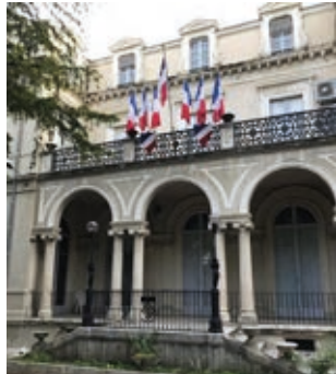
Immeuble du 3 Boulevard Henri IV, devenu siège de la Délégation Militaire Départementale de l'Hérault.