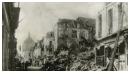
DR Une des rues de la Ville après le bombardement.

déversé des tonnes de bombes pendant 25 minutes, dévastant ainsi la ville et provoquant la mort de plus de 250 personnes.