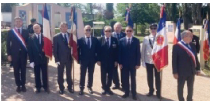
Délégation de Châteauneuf en présence de M. le Député et de M. le Maire