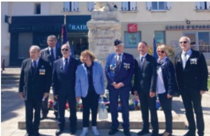
Les représentants des associations patriotiques.