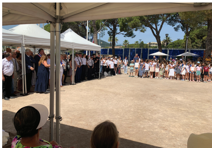
Participation de la classe de 4 ème de Limours durant leur séjour mémoriel dans le Var.