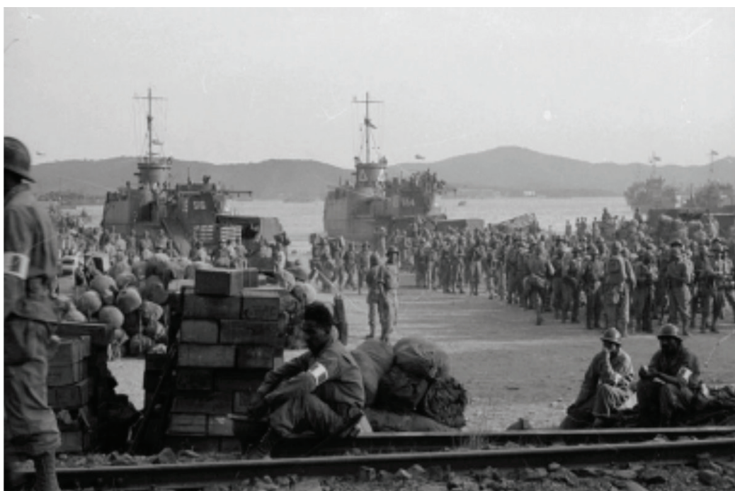
Août 1944, débarquement des troupes françaises sur les côtes de Provence

80 ème anniversaire des débarquements de Normandie et Provence